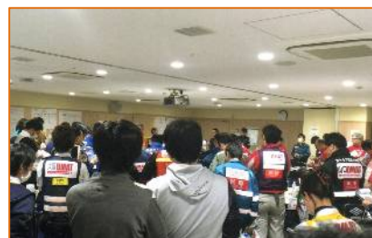
他府県DMATとのミーティング風景

災害時には、被災地からの要請を受けた厚生労働省や都道府県からの要請に基づいて、被災現場や拠点病院などにおいて医療救援活動に従事いたします。今回の熊本地震では、東京都の要請に基づき、弊院のDMAT隊が4月18日（月）より熊本に向かい、3日間医療救援活動のお手伝いをさせていただきました。滞在中、震度5強の地震に2度遭遇いたしました。無事に任務を果たし帰京いたしました。