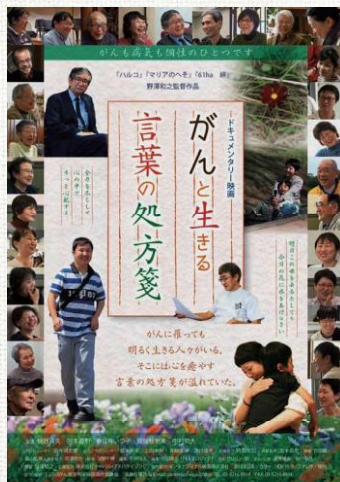
2018年製作 / 90分 / 日本 / 製作・配給: ©2018がん哲学外来映画製作委員会

映画は上映会の他12月16日(金)13時から12月17日(土)13時までの24時間以内は、お好きな時間に見ることができます。