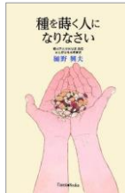
種を蒔く人になりなさい

苦しみに耐えれば、希望の光が見えてくる。無理をせずに一番になろうとしない。人は誰でも役割を持って生まれているのです。「がん哲学外来」を導く言葉集。