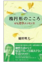
樋野先生のこころ

2018年度朝日がん大賞長興と郎賞受賞。個性を活かして、病気でなくても病人でない生活のために。明るく前向きに生きる考え方で、温かな言葉で、病理医が贈る心のメッセージ。