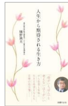
人生から期待される生き方

病は「終わり」ではなく、だからのために「始まり」ー。言葉の処方箋の元となる聖書から、永遠に変わることを願う希望を語る。悩みや苦しみを、病を越えて種を蒔く人生へと導く。