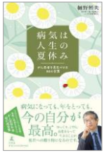
病氣は人生の夏休み がん患者を勇気づける80の言葉

病氣になっても、年をとっても、今の自分が最高。ゆっくり、丁寧に品性をもって生きることが、後世への贈り物になるのです。3000人以上の患者・家族に希望を与えたがん哲学外来初の蔵言葉。