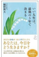
いい人生は、最期の5年で決まる

2018年度朝日がん大賞長興と郎賞受賞。個性を活かして、病気でなくても病人でない生活のために。明るく前向きに生きる考え方で、温かな言葉で、病理医が贈る心のメッセージ。