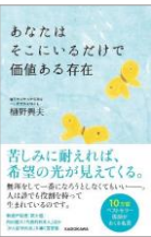
あなたはそこにいるだけで価値ある存在

結局、いい人生かどうかは、最期の5年間で決まるのです。では、どうすればいいの？「がん哲学外来」の創始者が教える絶対に入生を後悔しない生き方とは。