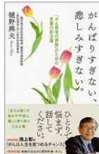
がんばりすぎない、悲しみすぎない。 「がん患者の家族」のための言葉の処方箋

講演や個人面談で、がん患者さんや家族に「こころの処方箋」を伝えている樋野医師。聖書のこころをベースに、つらい病の中でどう生きていくのか、その希望を語る。