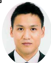
耳鼻咽喉科 な が ひ さ たいせい 永久 泰斉