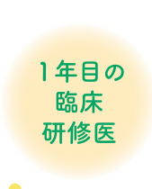
1年目の 臨床 研修医