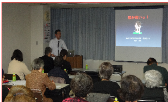
区民健康講座風景

脳に異常がなくても慢性的に、あるいは繰り返し起きてくる頭痛が一次性頭痛です。ズキンズキンと拍動性に痛む片頭痛、頭重感を主体とする緊張型頭痛、目の奥がえぐられるように痛む群発頭痛の3つがあります。