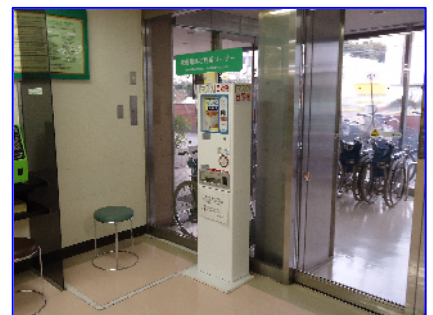
正面玄関内マスク自動販売機

今冬のインフルエンザの流行は、例年になく早い時期から始まりました。外出された際のマスク装用、帰宅時のうがい・手洗いは感染予防の必須事項となっています。中野総合病院では、ご来院の方の利便性を考慮して、マスクが必要な時にいつでも入手できるように、正面玄関に入って直ぐ右手(写真)と、西側通用口守衛室前の2ヶ所に「 マスク自動販売機 」を設置いた